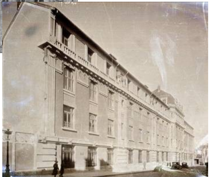
8 Fi 554