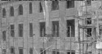
8 Fi 569