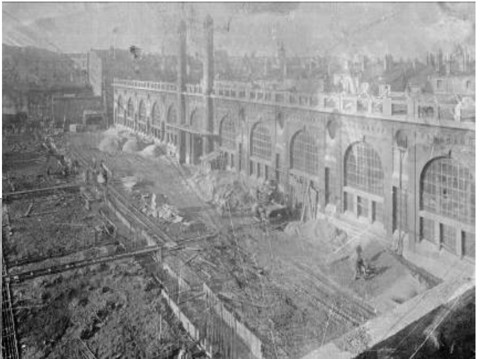
8 Fi 571