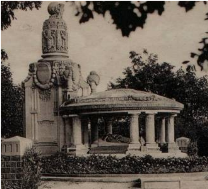
106 Fi 1626

De 1923 à 1928, il est l'..... de la ville de Nancy. Dans ce cadre, il réalise notamment trois écoles primaires (Fontenoy, Bonsecours, Alfred-Mézières) ainsi que l'école primaire supérieur Cyfflé.