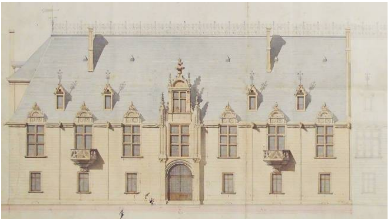
1 Fi non coté

En 1909, l'école accueille également des ..... . Ils s'adressent à des jeunes ....., de plus de 13 ans. Ce sont des formations à la fois théoriques et pratiques, qui permettent de compléter l'apprentissage chez le patron, en dehors de la journée de travail.