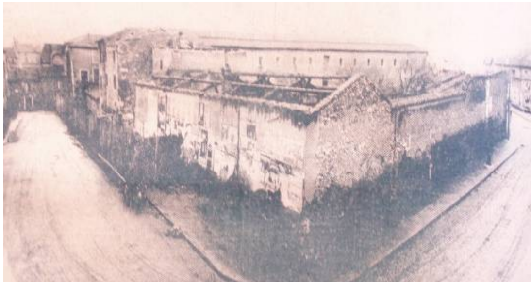
Bâtiments avant destruction L'Est illustré

A cet endroit, fut érigée l'abbaye Saint-Léopold en 1701. Le couvent a été occupé par les Bénédictins (qui ont été chassés au moment de la Révolution française – 1789-1799), puis par les Sœurs de la Visitation (au moment de la Restauration – 1814-1830). Les religieuses partent s'installer à la Cure d'air Saint-Antoine.