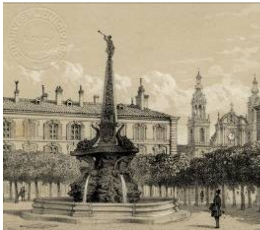
3 Fi 81