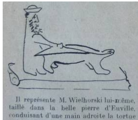
La Tribune de Lorraine, 25 janvier 1924

Il est aussi l'auteur du ..... ..... du cimetière du sud. Ce dernier est très controversé, la presse s'est fait l'écho des critiques dont l'édifice a fait l'objet.