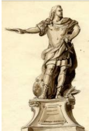
3 Fi 171