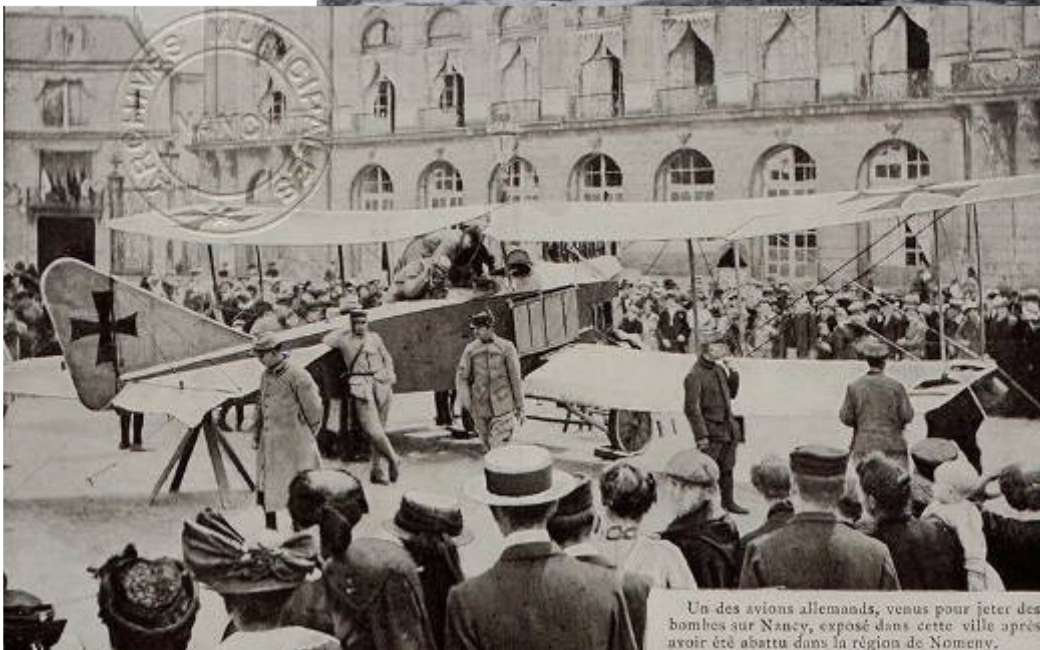
Un des avions allemands, venus pour jeter des bombes sur Nancy, exposé dans cette ville après avoir été abattu dans la région de Nomeny.

5° : À ton avis, lequel se trouve sur la première photographie ?