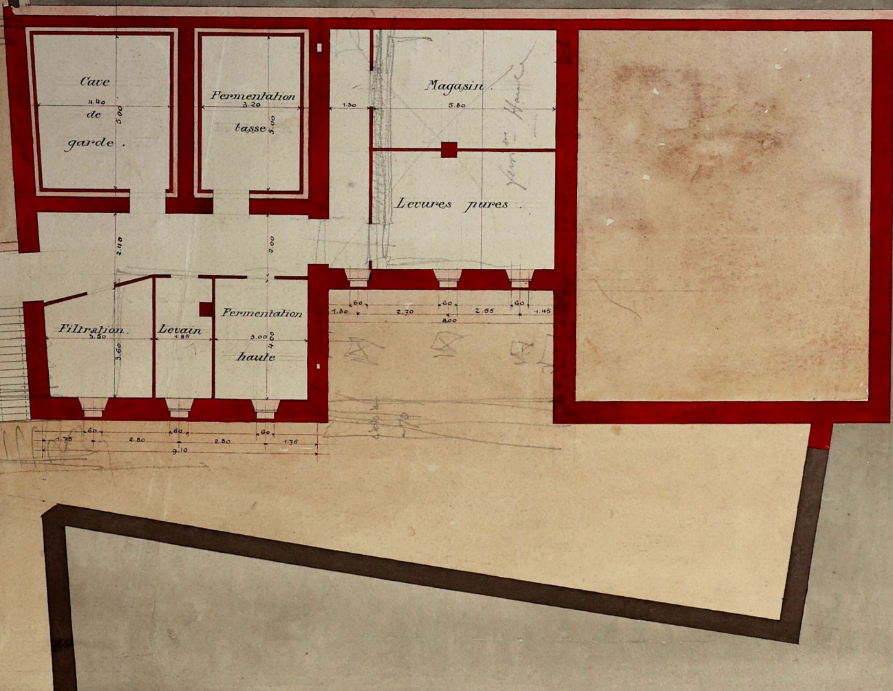
PLAN DU SOUS SOL