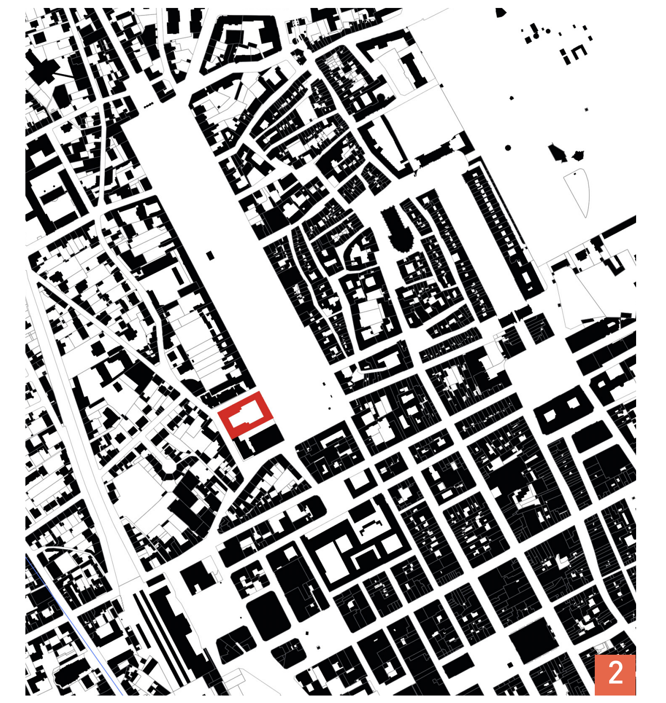
1. Cour intérieure du Palais de l'Université © ph. C. Bonno, Z. Collot 2. Plan de situation © dessin C. Bonno, Z. Collot © cadastre.gouv.

Enseignant : STEINMETZ Hugo — Étudiants : BONNO COLINE - COLLOT Zoé