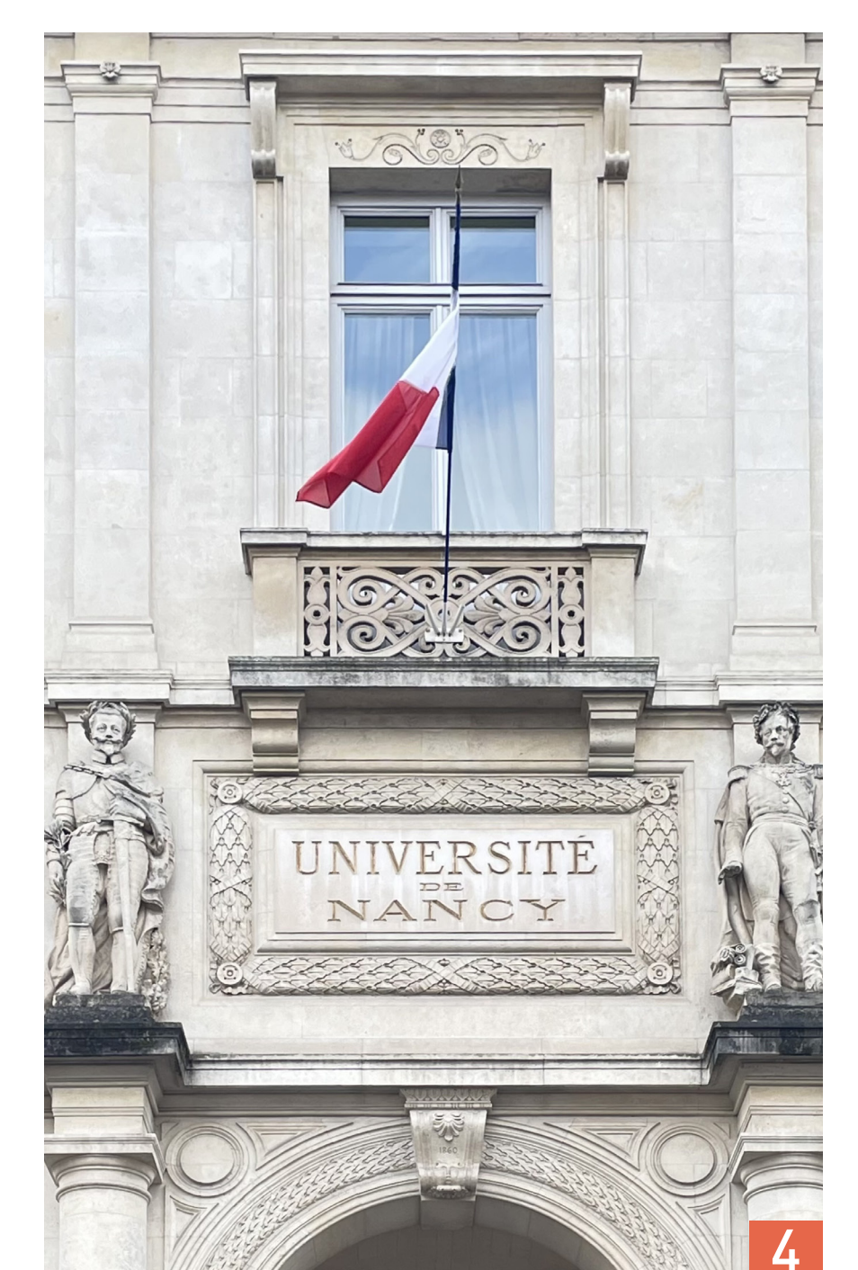
3. Façade principale par P. Morey AM Nancy, Cartes et Plans, 1FI4261© DR 4. Détails et sculptures sur la façade principale © ph. C. Bonno, Z. Collot

Pour en savoir plus : https://archives.nancy.fr/offre-culturelle-educative/offre-culturelle/expositions/parteneriat-ensan-les-edifices-denseignement/palais-de-luniversite