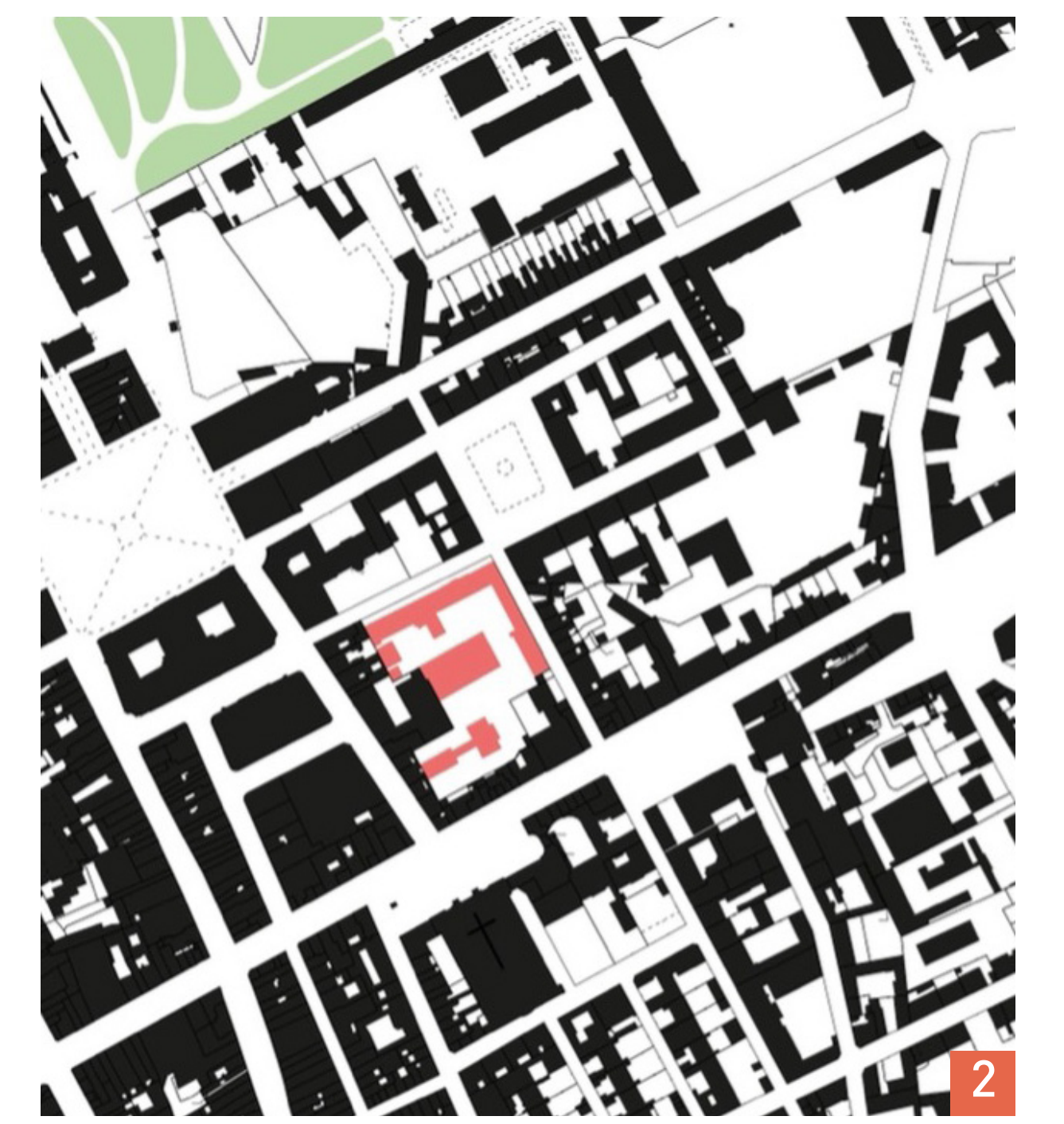
1. Vue de la façade principale 2. Plan de situation © dessin L. Ehret, B. Deloffre

Enseignant : GOUBIN Yann — Étudiants : Ehret Léa - DELOFFRE Bérénice