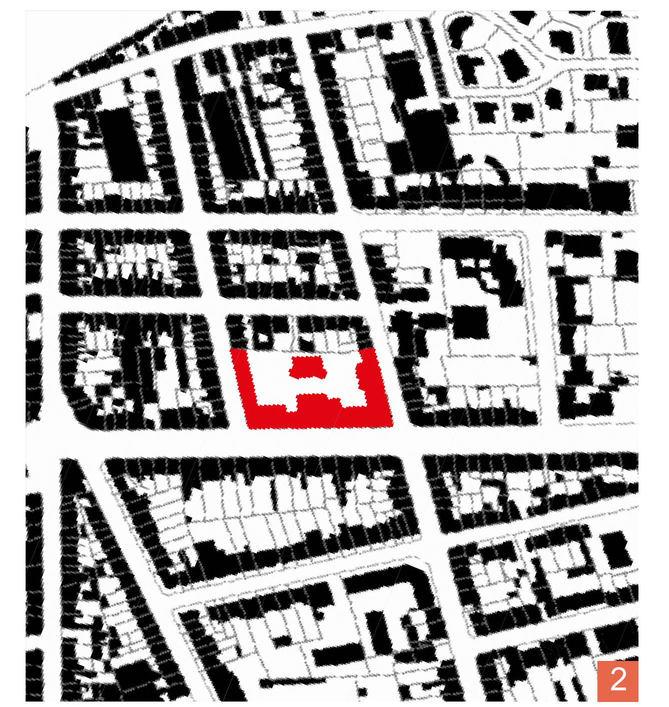
1. Façade principale © ph. A. Taillemaud, A. Bonnaud 2. Plan de situation © A. Taillemaud, A. Bonnaud © cadastre.gouv

Enseignant: MAURER Pierre - Etudiantes: TAILLEMAUD Alysia - BONNAUD Audrey