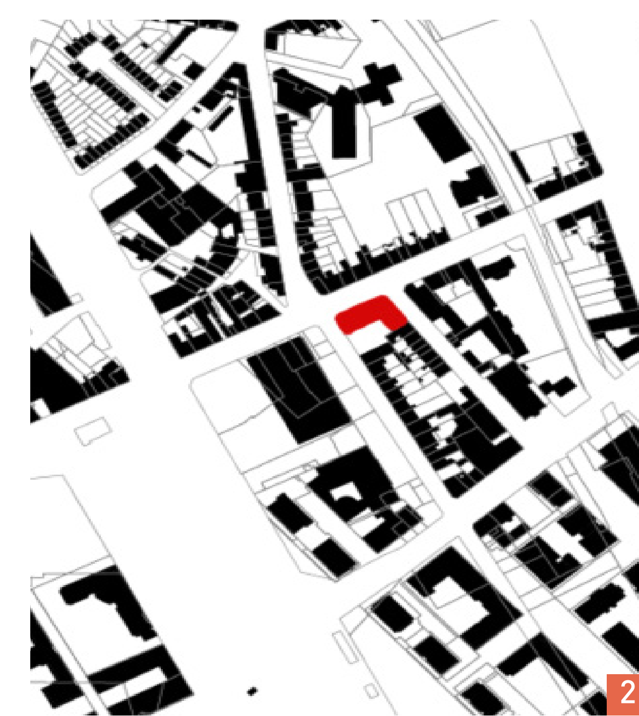
1. Façade de l'école © A. Fauré, A. Dehollain 2. Plan de situation © A. Fauré, A. Dehollain © cadastre.gouv

Enseignant : STEINMETZ Hugo — Étudiants : FAURÉ Alexandre - DEHOLLAIN Amaya